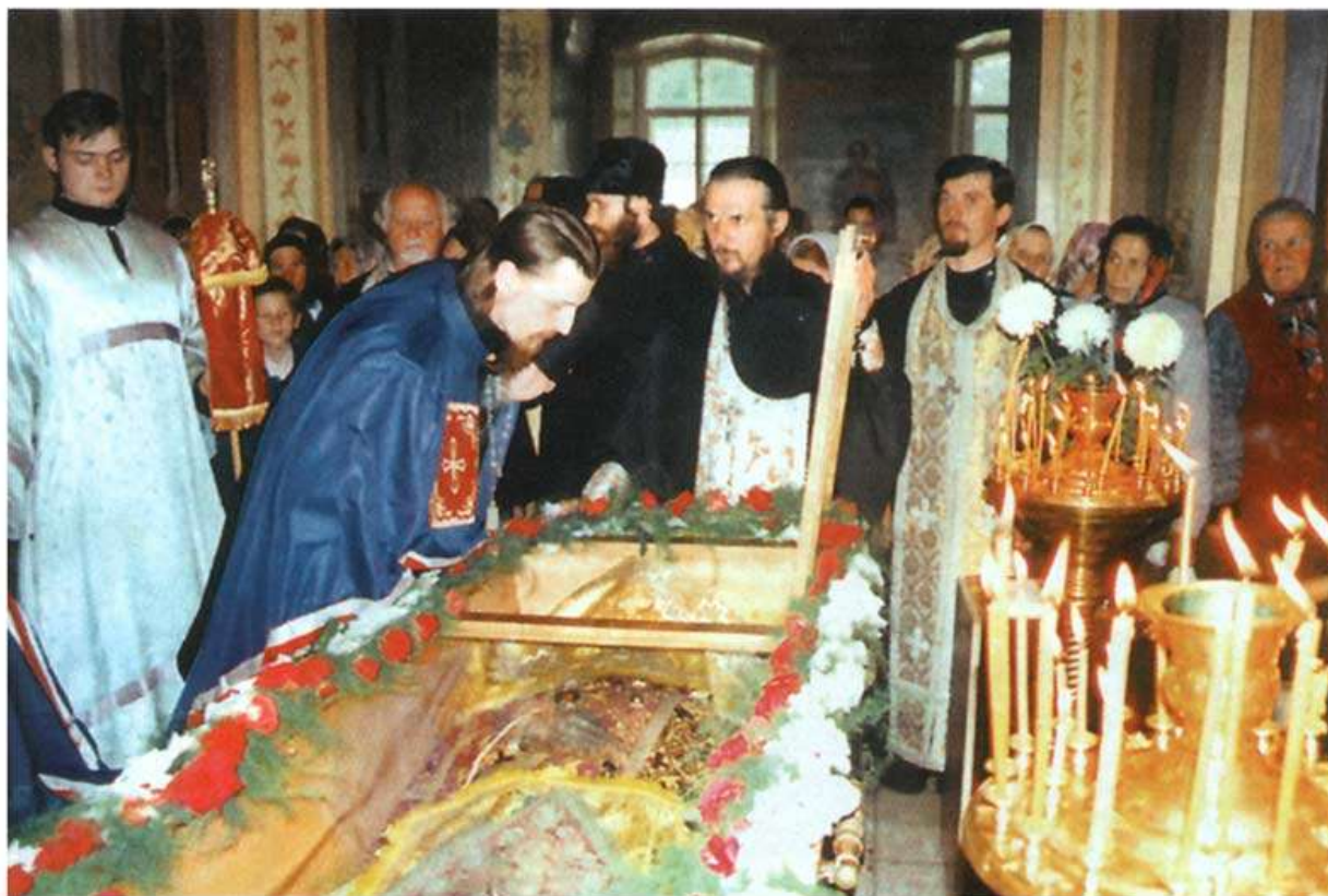
Преосвященный Иоанн, епископ Белгородский и Старооскольский у мощей Святого Иоасафа.

Два с половиной месяца тело лежало открытым в Свято-Троицком соборе, не предаваясь тлению и не теряя обычного вида. Только 28 февраля 1755 г. гроб с телом покойного был поставлен в пещере под собором.