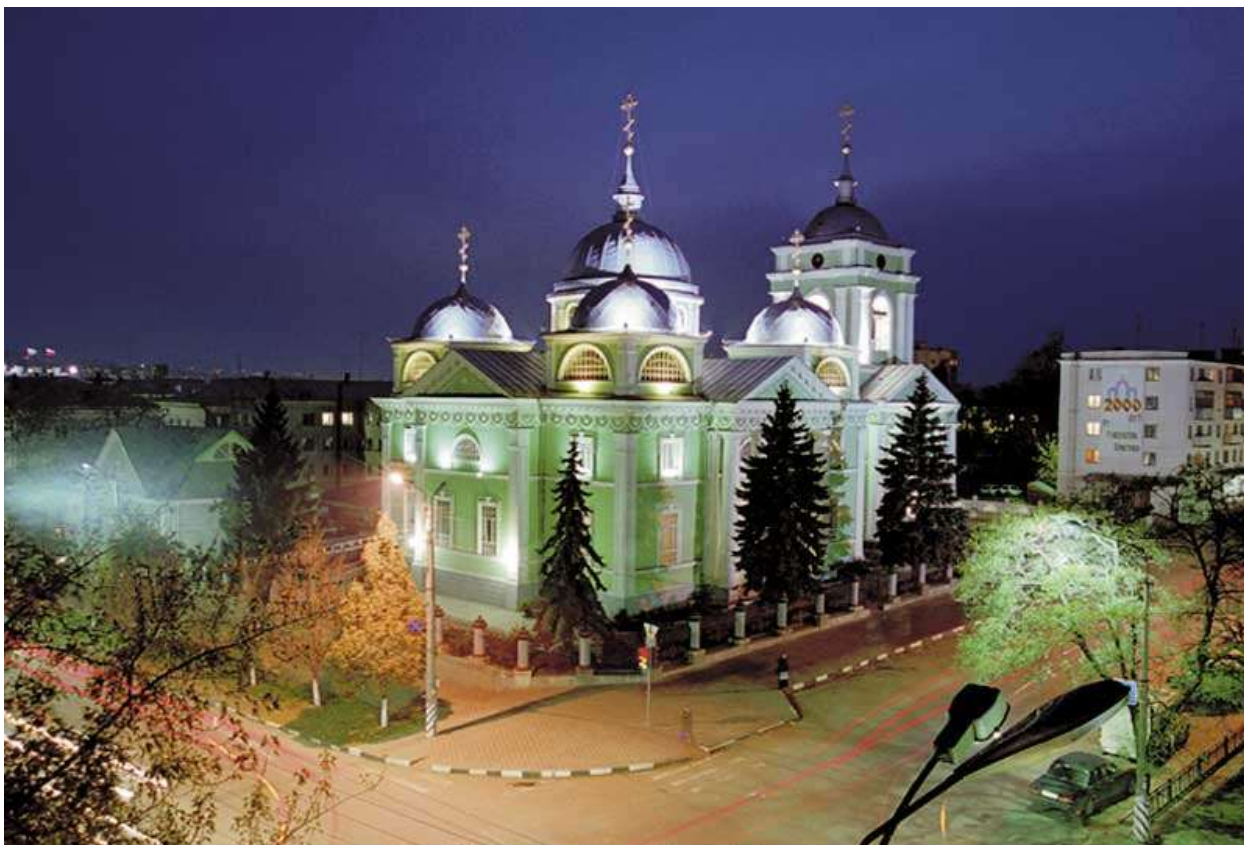
Преображенский собор. г. Белгород.

полутора веков белгородцы почитали Иоасафа Горленко святым, хотя официально он был канонизирован лишь в 1911 г.